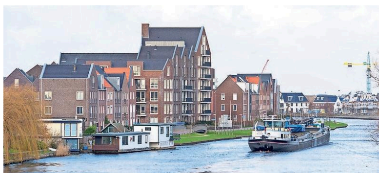
De skyline van nieuwbouwwijk 't Duyrak.

De bewoners krijgen het op zaterdag 24 november tijdens een feestelijke bijeenkomst die het einde van de bouwwerkzaamheden markeert.